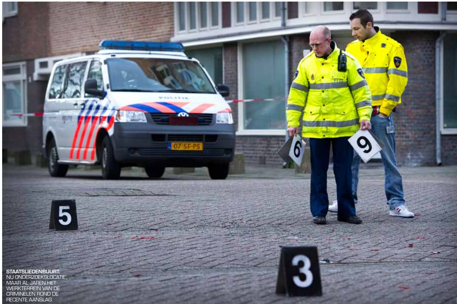
STAATSLIEDENBUURT. NU ONDERZOEKSLOCATIE, MAAR AL JAREN HET WERKTERREIN VAN DE CRIMINELEN ROND DE RECENTE AANSLAG.