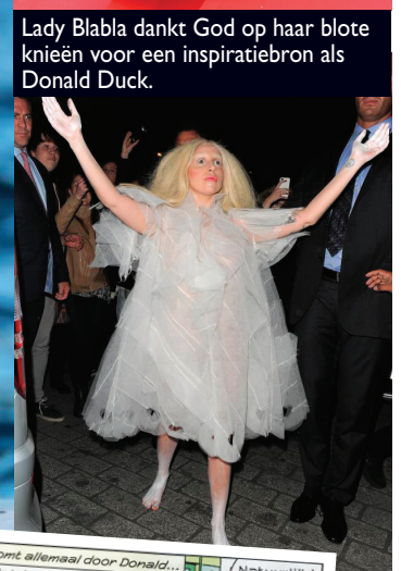
Lady Blabla dankt God op haar blote knieën voor een inspiratiebron als Donald Duck.

OOK MAGAZINE 'KATRIEN' SPOTTE DE TREND ONLANGS EN HAALDE ZO EEN WITVOETJE BIJ ONS VAN 'BEAU MODE'.